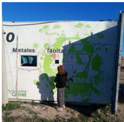
Imagen 5; Tráiler del CRP