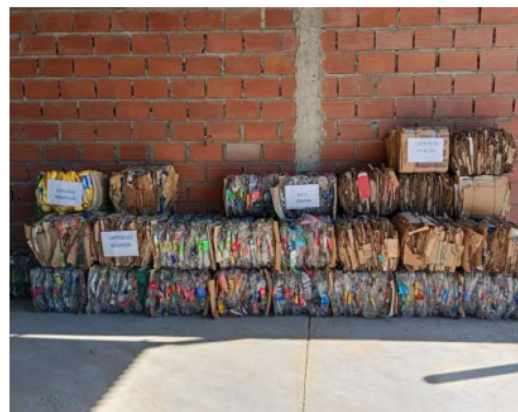
Imagen 6: Fardos clasificados en CRP