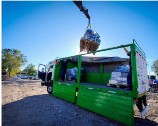
Imagen 7: Retiro de RAEE