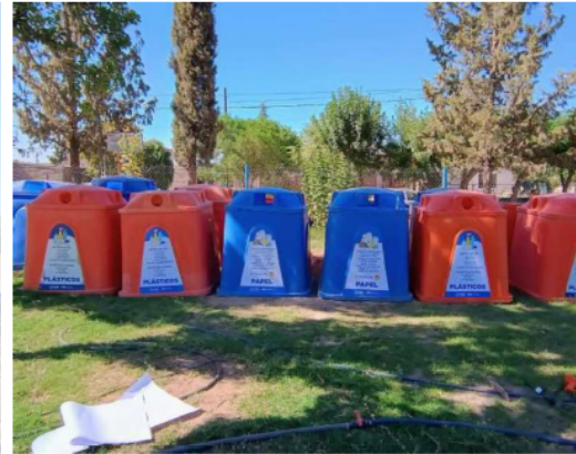
Imagen 8: Campanas reacondicionadas para recepción de plástico y papel.