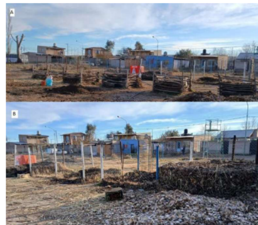
Imagen 10: Composteras ubicadas en el Vivero Municipal. A) Composteras pequeñas- B) Composteras grandes.