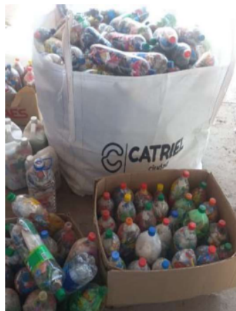
Imagen 9: Eco-botellas recolectadas en campaña de concientización ambiental