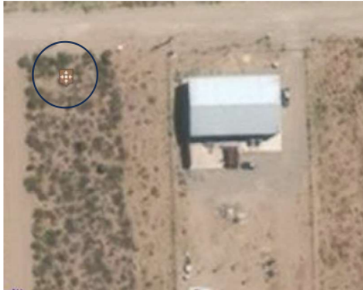
Imagen 1: Galpón Miel Monte Austral y punto de coordenadas que figuran en solicitud de información.