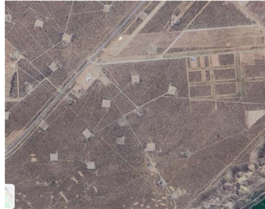
Imagen 2: Imagen satelital del yacimiento con pozos hidrocarburíferos inactivos.