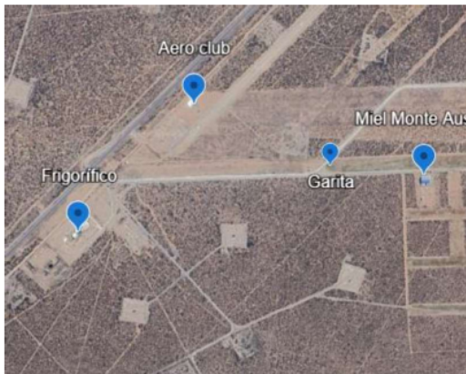
imagen 3: Actividades sociales y productivas en inmediaciones.