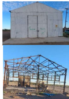
Imagen 4: Galpón ubicado antes y después de la incineración y desmantelamiento